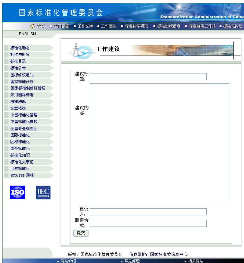
圖 3 國家標準化管理委員會 提交建議畫面

「國家標準化管理委員會」網站，共有兩大意見回饋管道，一為提交建議方式，此一工作建議，為所有使用者皆可使用之功能。